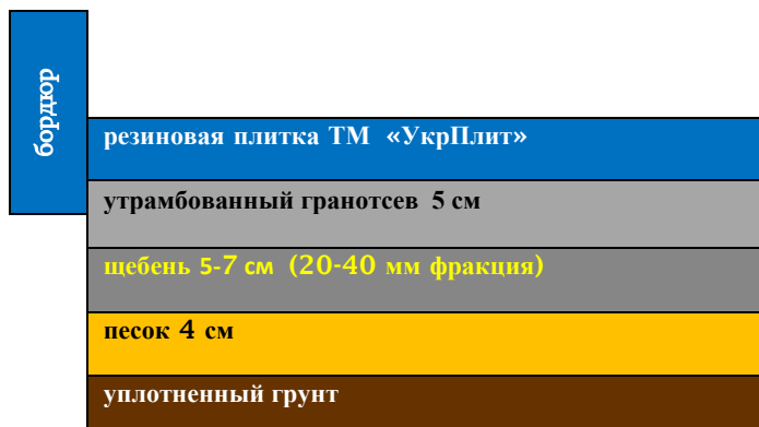
Рис.3 – Подготовка основания для укладки резиновой плитки на ПГС: